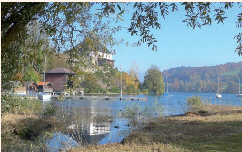
Kunst hat ihren Ort